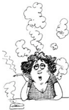
Comment puis-je encourager mon ado à cesser de fumer?

Combien de jeunes fumeurs ont fumé « en cachette » avant de se faire prendre « en flagrant délit » par leurs parents? C'est sans doute le cas de la plupart d'entre eux. Quand cela se produit, les parents sont souvent furieux. Il faut cependant se demander si cette réaction est associée au fait que le jeune fume ou plutôt au fait qu'il a dissimulé qu'il fumait, car on répète souvent à nos jeunes de faire preuve d'honnêteté. Face à cette situation, l'idéal serait de parler ouvertement à nos parents en dissociant nettement le fait d'avoir fumé en cachette et le fait d'être devenu fumeur.