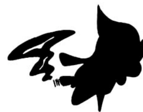
C'est ça fumer en cachette?

sais-tu où tu peux te procurer des renseignements valables et à jour?