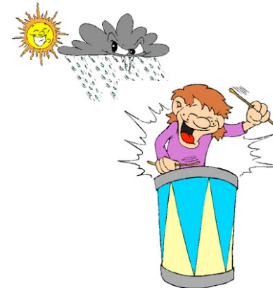
Beau temps, mauvais temps, c'est dur à croire que ça va finir un jour!!

irrécyclables durant cette étape de développement de la personne. Ils ne tardent pas à laisser leurs adolescents se débrouiller seuls en prétextant leur besoin d'autonomie mais en réalité, ils les abandonnent à eux-mêmes. C'est là une grave erreur qui revient à une forme de rejet. Les jeunes saisiront rapidement qu'ils sont délaissés. Ils se tourneront vers d'autres personnes qui ne seront pas toujours d'une grande crédibilité.