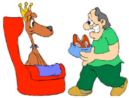
C'est vous qui avez fait de nous des enfants rois!

Dans la première partie, les jeunes ont mentionné leur besoin d'amour inconditionnel , de respect mutuel , de compréhension, de soutien et d'encouragement. Voyons maintenant les autres composantes humaines qui les touchent bien souvent au plus profond d'eux-mêmes. À nouveau, ils nous rappellent d'une part, que le soutien des parents à l'adolescence est indispensable et d'autre part, que la façon de nous y prendre avec eux contribue directement à faire en sorte que nos rapports soient plus souvent positifs que négatifs.