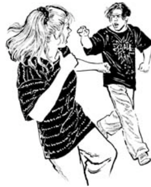
Si seulement on savait se parler!

cette souffrance augmente ou diminue, car ils sont souvent les modèles qu'on imite. Il est donc essentiel de prendre conscience du rôle que ces meneurs sont appelés à jouer dans la société. Même s'ils ne jouent pas un rôle actif, le simple fait de mettre fin au ridicule ou au mépris améliorera la situation de la personne rejetée.